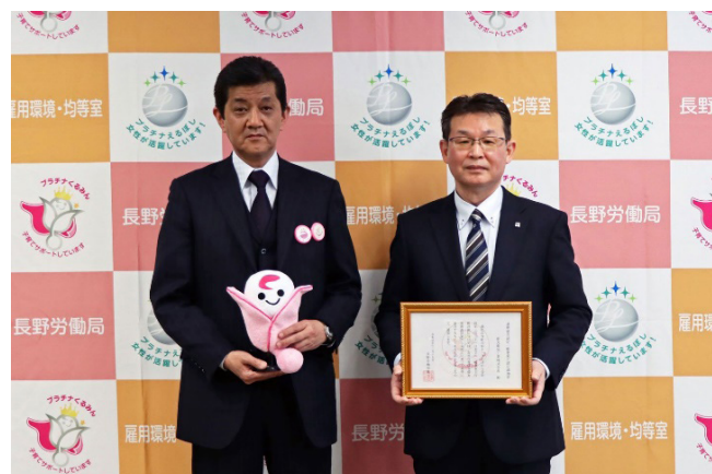
（2023年1月27日 認定交付式）