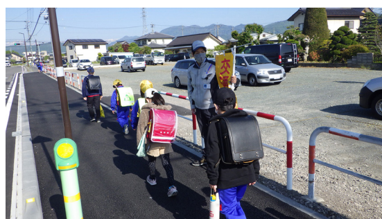
（交通安全街頭啓発活動）

「全国交通安全運動」に合わせて、交通安全の街頭啓発活動を実施しています。特に、地域の小学生が安全に登校できるように、声を掛けながら見守り活動を行い、子供の交通事故防止に取り組んでいます。今後も交通事故ゼロ社会の実現に向け、地域の皆様と一丸となって、交通ルールの遵守と正しい交通マナーの実践に取り組んでまいります。