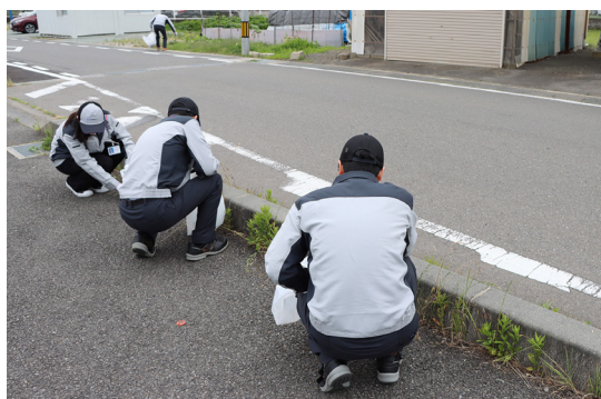
(工場近隣の清掃活動 (更北工場))

当社は、毎年6月に実施する環境月間を中心に、工場周辺においてゴミ拾い等の美化活動を行っています。今後も工場周辺地域の美しい環境が次世代に引き継がれるよう、地道に活動を行ってまいります。