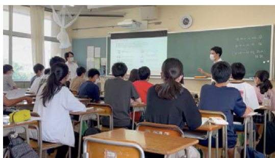
（高校生のキャリア教育支援活動）

社員が卒業した母校を訪れて、製造業界の仕事内容や会社概要を説明するとともに、自身の経験を紹介することなどにより、今後の進路選択に役立てていただける機会となっています。