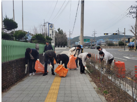
(工場周辺の清掃活動)

KSM（韓国）では、工場が所在する工業団地周辺道路の清掃活動を毎年実施しています。清掃活動と併せて、ごみの無断投棄防止のための啓発活動も行っています。