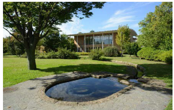
（栗田総合センター）

栗田総合センターは、春の桜や秋の紅葉等、道行く人々が四季折々の自然の息吹を感じることができる地域における憩いの場となっています。