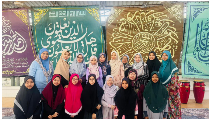
(孤児院訪問の様子)

SEM（マレーシア）では、孤児院への寄付活動を実施しています。2023年度はSEMの社員が孤児院を訪問し、子どもたちと交流を深めました。