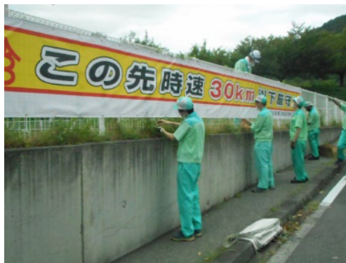
〔若穂工場における活動〕