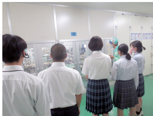
〔高校生への工場説明（新井工場）〕

新光電気グループでは次世代を担う学生の「職業観確立・適性発見」の有効な足掛かりになるよう、インターンシップの受け入れも行っています。