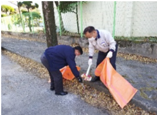
〔KSMによる工場近隣の清掃活動〕

KOREA SHINKO MICROELECTRONICS CO., LTD. (KSM：韓国)では、工場近隣の道路や河川の清掃活動を行いました。工場周辺地域の美しい環境が次世代に引き継がれるよう、地道に活動を行ってまいります。