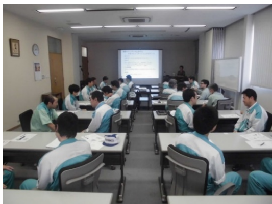
〔コミュニケーションスキル向上研修〕

そのほか、メンタルヘルス不調の未然防止（一次予防）を目的に、年1回ストレスチェックを実施し、集団分析結果を各部門責任者へ適切にフィードバックするとともに、リーダークラスを対象とした職場環境改善・コミュニケーション向上のためのスキル開発研修を実施するなど、積極的な職場環境改善活動を推進しています。