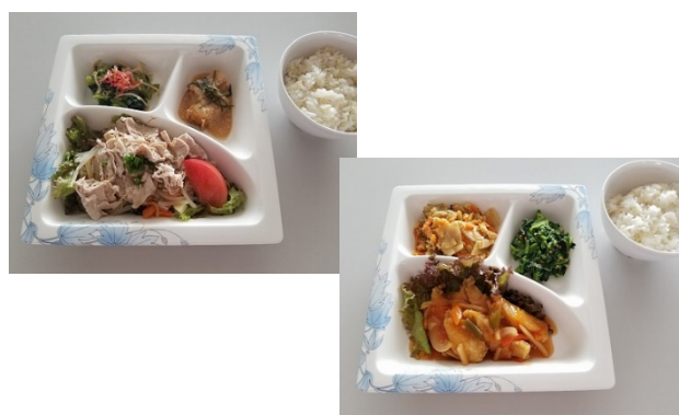
〔社員食堂で提供する「スマートミール」〕

また、スマートフォンアプリを活用したウォーキングイベント、禁煙推進イベントなどの健康増進活動を実施しているほか、社員食堂では、健康に資する要素を含む栄養バランスのとれた「スマートミール」や「食育の日（毎月19日）」に健康テーマに合わせたメニューを提供するなど、他部門とも協働し社員の健康維持・増進に努めています。