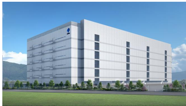
千曲工場竣工イメージ

パソコンやサーバーなどに搭載されるCPU等の高性能半導体向けフリップチップタイプパッケージは、半導体の高機能化・高速化と省電力化に対応する半導体パッケージとして、今後も旺盛な需要が続くことが見込まれております。当社におきましては、これまで更北工場（長野市）、若穂工場（同）および高丘工場（長野県中野市）において、フリップチップタイプパッケージの生産体制強化に努めてまいりましたが、さらなる生産能力拡充をはかるべく、2021年10月4日付当社プレスリリース「成長市場向け設備投資の実施について」によりお知らせいたしました新拠点を上記のとおり長野県千曲市に開設するものです。これにより、当社の工場は計6工場となります。